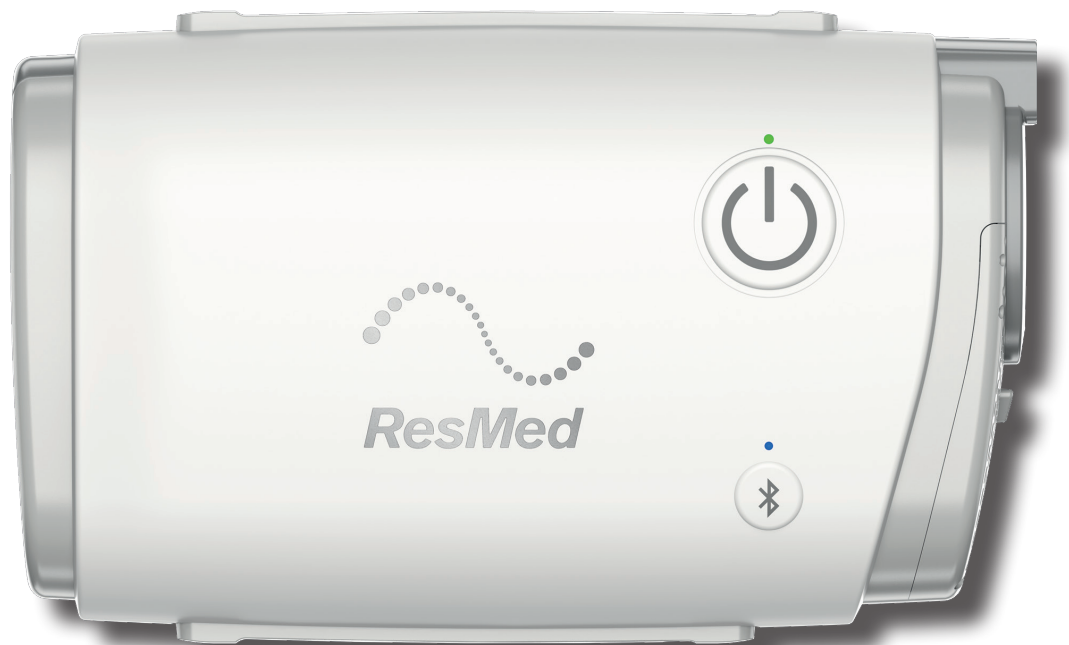
13,6 cm, werkelijke afmeting

Reizen met een CPAP- apparaat wordt vanzelfsprekend: